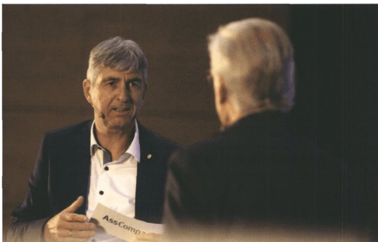
Vor der Verleihung wurde der Stellenwert der AssCompact Studien hervorgehoben, die ein genaues Bild des unabhängigen Vertriebes über die Produkthanbieter zeichnen

Mit insgesamt drei ersten Plätzen ist die Generali große Gewinnerin der begehrten AssCompact Awards 2022, die am 5. Oktober in der Pyramide Wien/Vösendorf vergeben wurden. Das Feedback der unabhängigen Vermittler war groß: Bei den zwei Umfragerunden wurden insgesamt 2.016 gültige Votings in fünf Sparten verzeichnet.