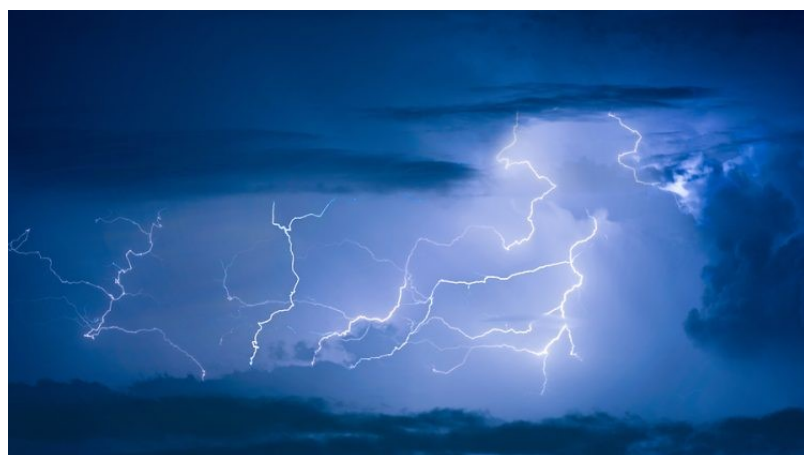
Wichtig: Eine Absicherung gegen Sturmschäden

Doch welche Vorteile bringt eine solche Versicherung mit sich, wann ist sie notwendig und was kostet es, dass eigene Heim entsprechend absichern zu lassen? Welche Leistungen sind enthalten und wer sind die aktuellen Anbieter auf dem Markt in Österreich.