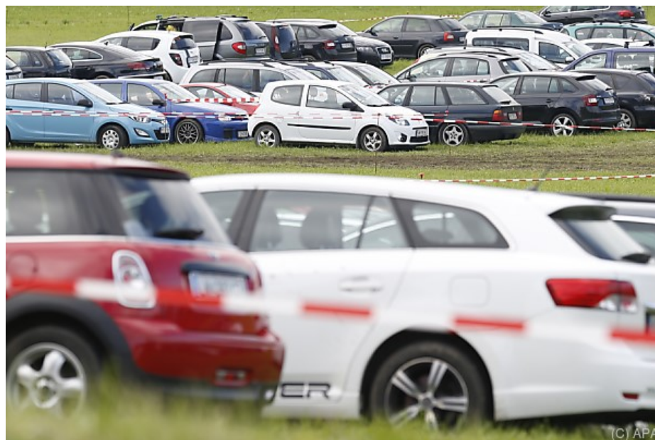
Zumindest einmal pro Woche fahren fast drei Viertel mit dem Auto - © APA

21. März 2018 14:20 Akt.: 21. März 2018 14:40