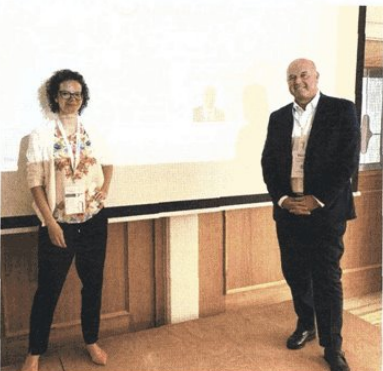
Das Referenten-Duo von COGITANDA