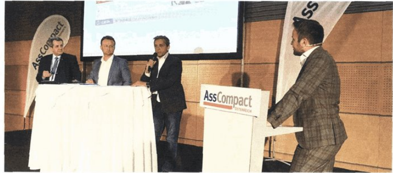
Die Diskussionsrunden mit den Standesvertretern stießen bei allen vier Stationen auf großes Interesse