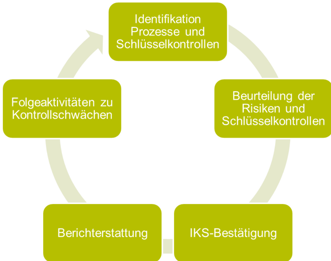
Abbildung: Ablauf des IKS-Regelprozesses

Die übergreifende Beurteilung des IKS der VHV Gruppe basiert auf dem nachfolgend beschriebenen Regelprozess. Dieser unterstützt die systematische Beurteilung des IKS nach einem einheitlichen Verfahren.