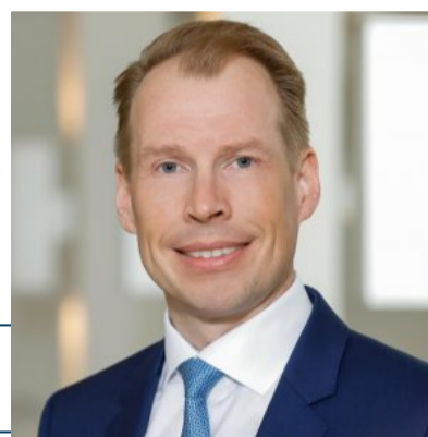
Sven Rabe, Vorstandsvorsitzender der VAV Versicherung

So sind 16 Prozent der an der Studie zum VAV Wohnbarometer 2022 teilnehmenden Probanden überzeugt, dass die Erderwärmung keineswegs eine Verhaltensänderung abverlangen wird. 35 Prozent glauben, dass es „eher nicht“ zu aufgenötigten Einschränkungen kommen wird.