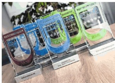
Sechs Banken und Versicherungen durften sich in diesem Jahr über Awards freuen

denheit verzeichnete. Seit 2018 werden im Rahmen der FMVÖ-Recommend-Gala auch die Leistungen der Kundenbetreuer prämiert. Den höchsten NPS-Wert erzielten diesmal die Berater der Erste Bank, im Versicherungsbereich ging der Preis an die Generali. Ein weiterer Sonderpreis ist die Auszeichnung „Beste Schadensbearbeitung“, bei der sich die Helvetia durchsetzen konnte.