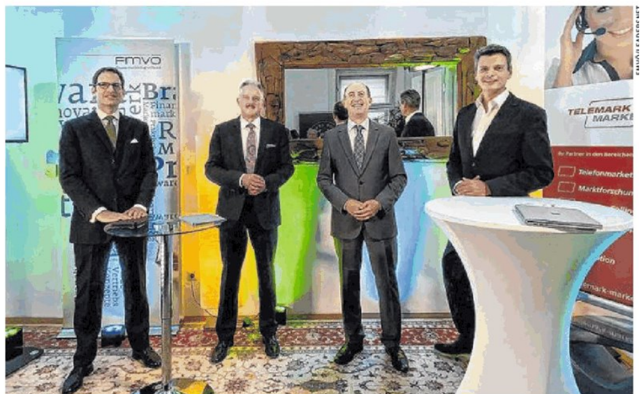
In diesem Jahr wurde der FMVÖ-Recommend-Award im Studio vergeben

Gewinner der Sonderpreise. Zusätzlich zum FMVÖ-Recommend-Award wurden vier Sonderpreise verliehen. Die Auszeichnung als „Aufsteiger des Jahres“ erhielt in diesem Jahr die VKB-Bank, die den größten Zuwachs an Kundenzufrie-