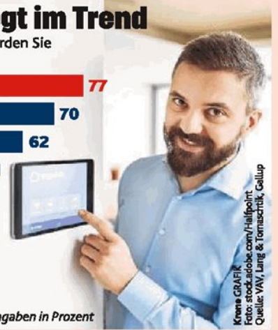
Kronen GRAPHIK Foto: stock.adobe.com/Hillpoint Quelle: VAV, Lang & Tomaschitz, Gallup