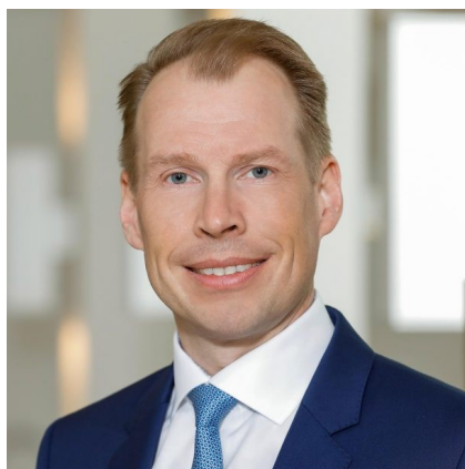
Sven Rabe, Vorstandsvorsitzender der VAV Versicherung

Laut einer Studie der VAV glaubt eine Mehrheit der berufstätigen ÖsterreicherInnen, dass sich ihre Einkommenssituation durch die Corona-Pandemie nicht verändern wird. Immerhin 44 Prozent – 45 Prozent der Frauen und 42 Prozent der Männer – setzen auf gleichbleibende Einkünfte.