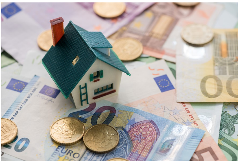
Wichtig: Kosten für die Mietkautionsversicherung vergleichen

Dieses Versicherungsprodukt in Österreich wird genauso gehandhabt, wie dies in Deutschland der Fall ist. Deshalb kann eine solches Mietkautionsversicherung auch bei einem Umzug von Österreich nach Deutschland und umgekehrt hilfreich sein.